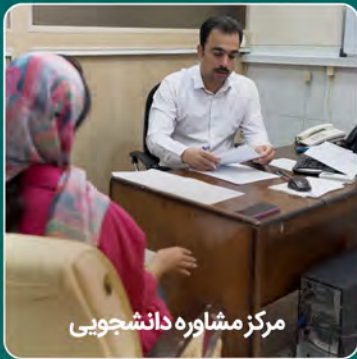
مرکز مشاوره دانشجویی