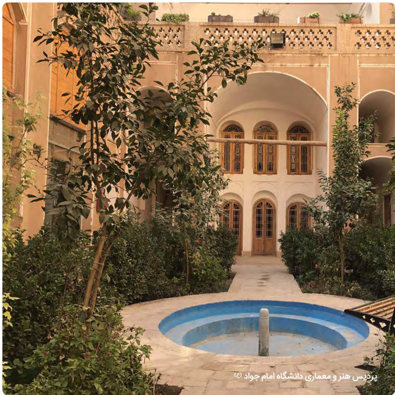
پردیس هنر و معماری دانشگاه امام جواد (ع)