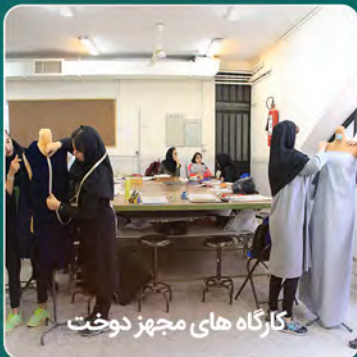
کارگاه های مجهز دوخت