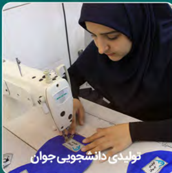
تولیدی دانشجویی جوان