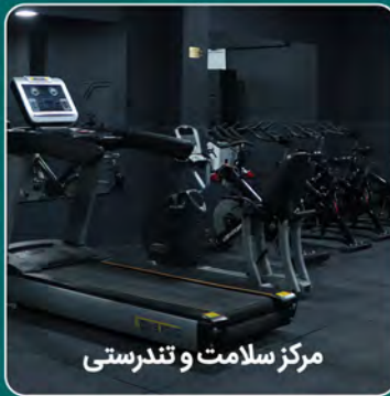
مرکز سلامت و تندرستی