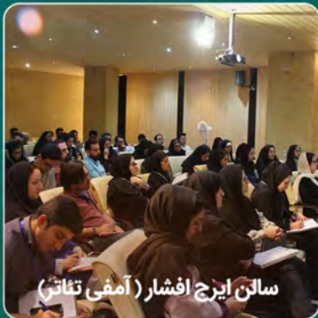
سالن ایرج افشار ( آمفی تئاتر )